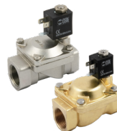
2-weg servo-gestuurde elektro-pneumatische ventielen, met membraan, behuizing messing of RVS.