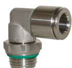
Insteekkoppelingen AISI 316, leidingdiameter Ø 4 tot Ø 12, aansluiting 1/8" tot 1/2".