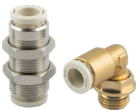
Koppelingen vervaardigd uit loodvrij messing Serie F-E PLUS en F-NSF PLUS, diameters Ø 4 tot Ø 10 mm Draadaansluitingen M5 tot 1/2".