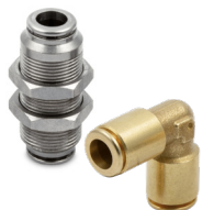
Insteekkoppelingen ontlod messing, serie F-E en F-NSF, leidingdiameter Ø 4 tot Ø 10, aansluiting M5 tot 1/2".